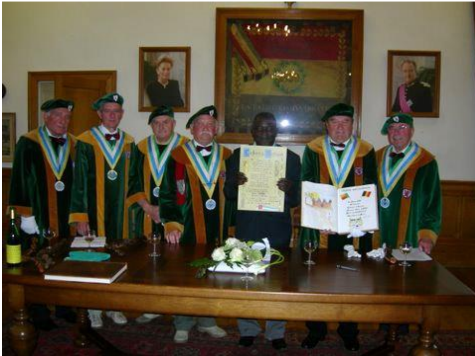
Le maire de BEMBEREKE , 1 er échanton d'honneur africain au sein de la Confrérie du Maitrank