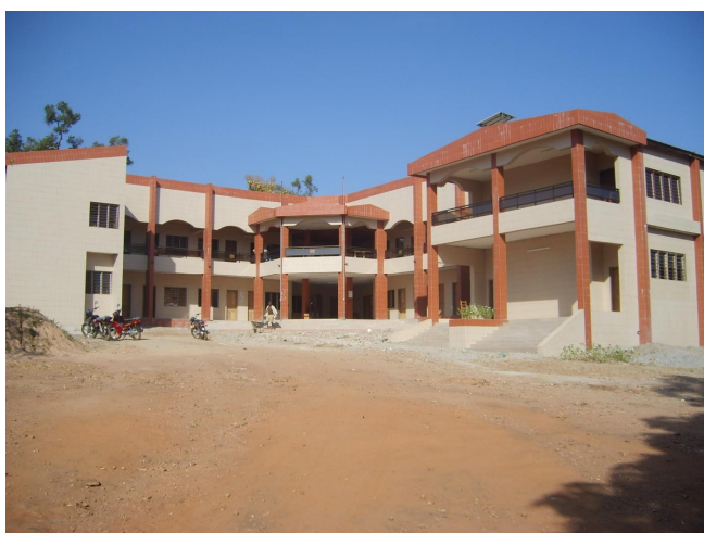
Le nouveau bâtiment de la mairie