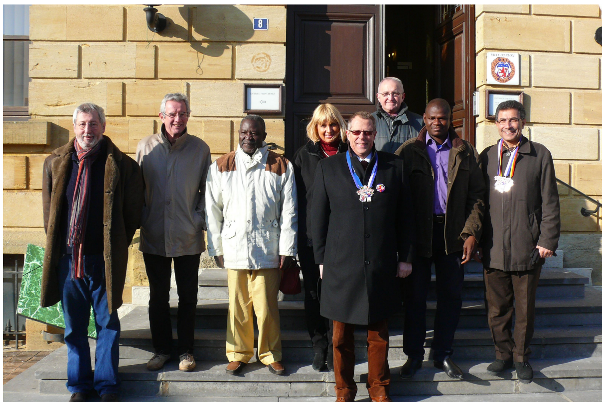
La visite de nos amis de BEMBEREKE lors de l'atelier BENIN tenu du 4 au 8 mars 2013 à ARLON et HUY.