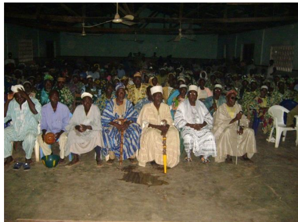
L'importance des chefs traditionnels et religieux dans la prise de décision