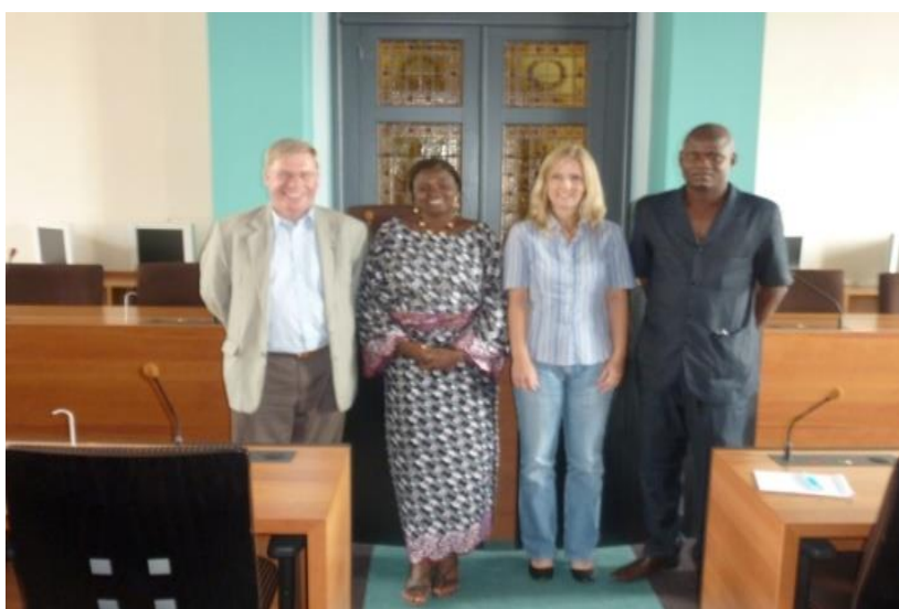
Mission de nos amis de BEMBEREKE au service des Finances