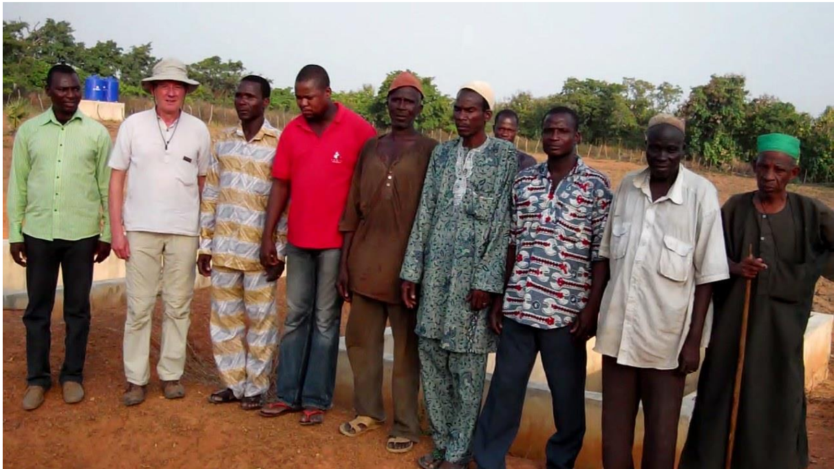
Retenue d'eau de PEDAROU : le comité de gestion (11/2012)

La seule difficulté rencontrée (entretemps résolue) était le retard constaté dans la livraison du système d'arrosage avec panneaux photovoltaïques.