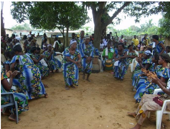
L'accueil à BEMBEREKE

Pour plus de renseignements : http://www.uvcw.be/espaces/international/68.cfm