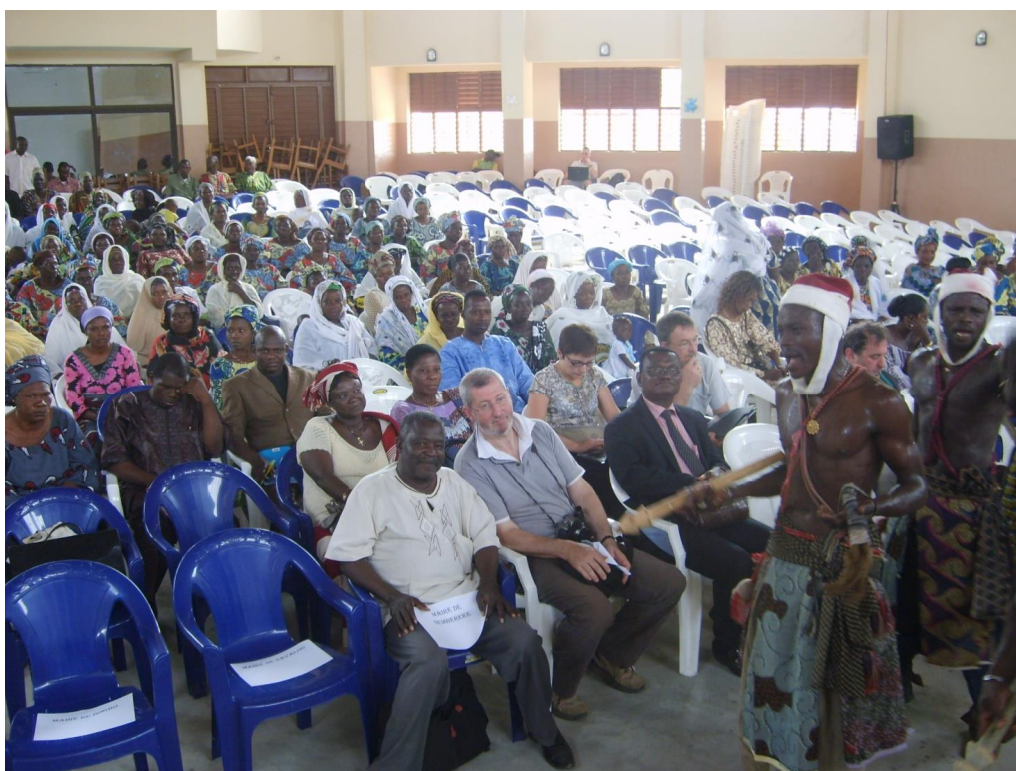
Plateforme Nord Sud à Tchaourou (en partenariat avec Virton)