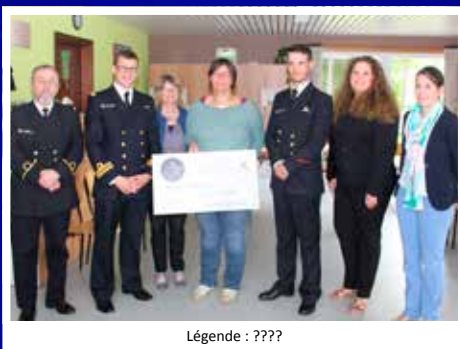
Légende : ????