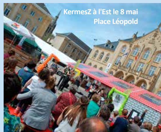
KermesZ à l'Est le 8 mai Place Léopold