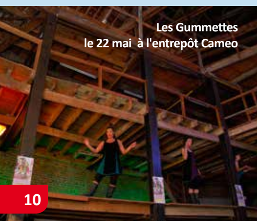
Les Gummettes le 22 mai à l'entrepôt Cameo