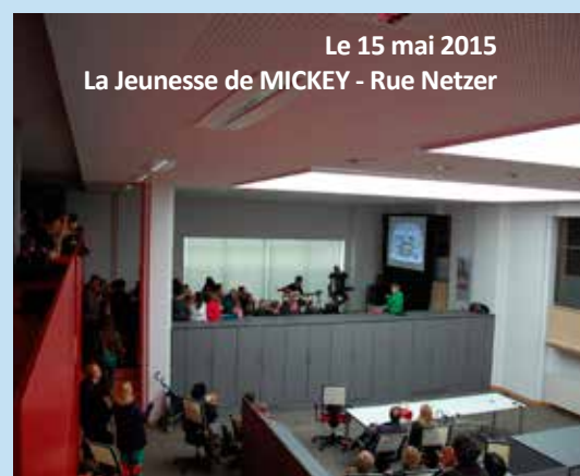
Le 15 mai 2015 La Jeunesse de MICKEY - Rue Netzer