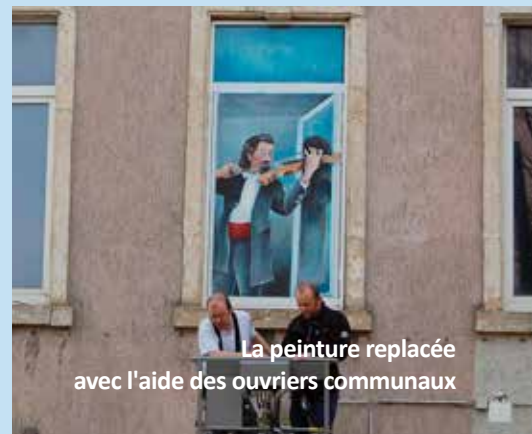
La peinture replacée avec l'aide des ouvriers communaux