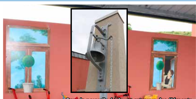
Dans la nouvelle école, on retrouve des éléments symboliques des deux anciennes entités : les peintures qui étaient fixées sur les fenêtres de la maison du maître à Sterpenich et la cloche de l'école de Barnich