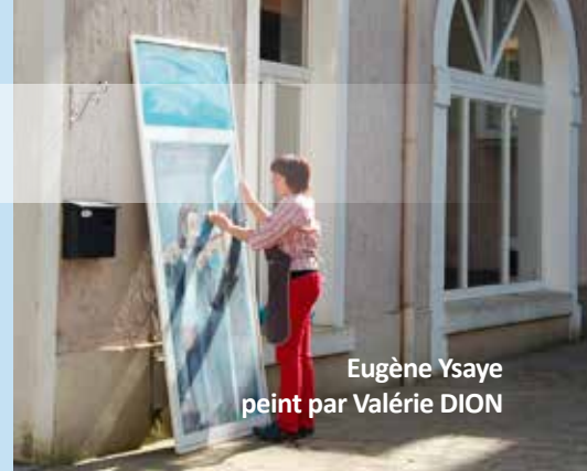
Eugène Ysaye peint par Valérie DION

Notez déjà qu'avec tous les échos enthousiastes des spectateurs, l'ASBL Arlon Centre-Ville réitérera certainement pour votre plaisir les Pauses Culture en mai 2016.