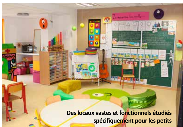
Des locaux vastes et fonctionnels étudiés spécifiquement pour les petits