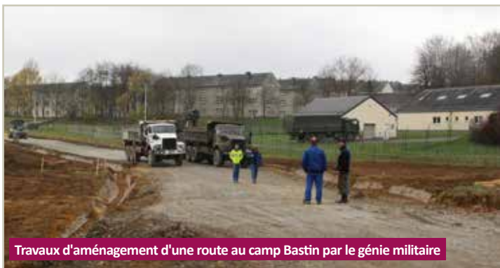
Travaux d'aménagement d'une route au camp Bastin par le génie militaire

Un toutes-boîtes sera distribué par la Croix-Rouge et Fedasil afin d'informer la population.