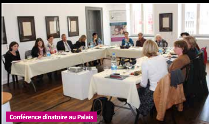
Conférence d'înatoire au Palais