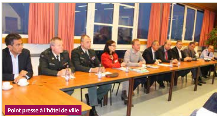
Point presse à l'hôtel de ville