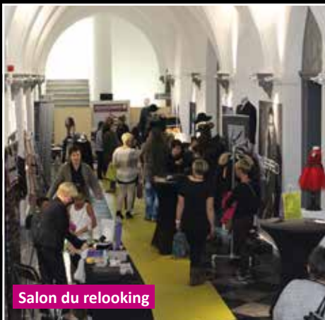
Salon du relooking