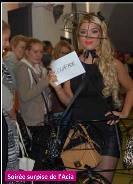
Soirée surprise de l'Acia