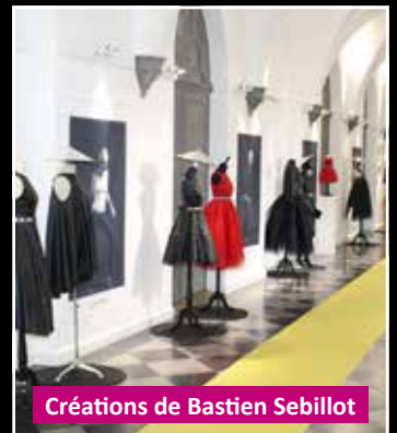
Créations de Bastien Sebillot