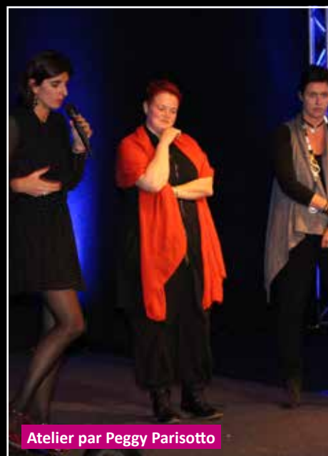
Atelier par Peggy Parisotto