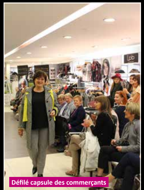
Défilé capsule des commerçants