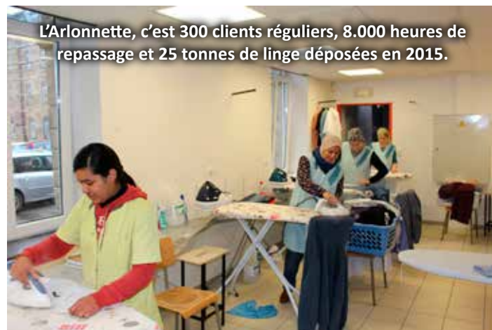
L'Arlonnette, c'est 300 clients réguliers, 8.000 heures de repassage et 25 tonnes de linge déposées en 2015.

Une carte de fidélité vous octroiera 10% de réduction sur le total au 10ème dépôt.