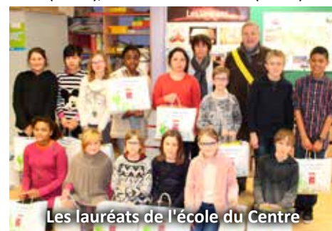
Les lauréats de l'école du Centre