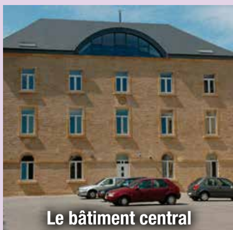
Le bâtiment central

Administration centrale des services Caserne Léopold Rue Godefroid Kurth, 2/i, 6700 ARLON