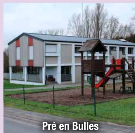
Pré en Bulles