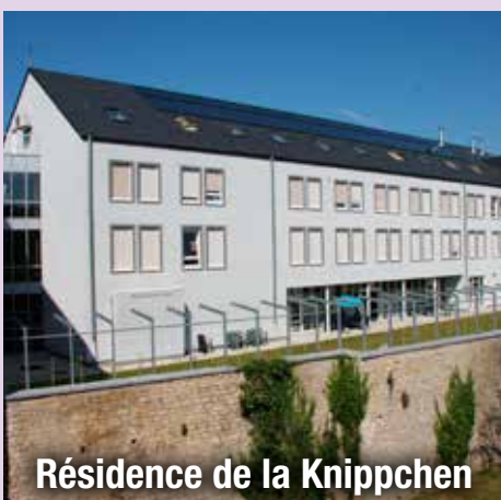
Résidence de la Knippchen

Administration centrale des services Caserne Léopold Rue Godefroid Kurth, 2/i, 6700 ARLON