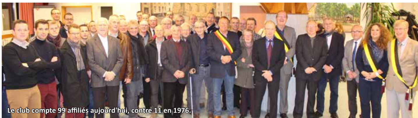
Le club compte 99 affiliés aujourd'hui, contre 11 en 1976.