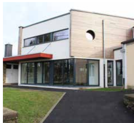
L'équipe éducative de la nouvelle école primaire