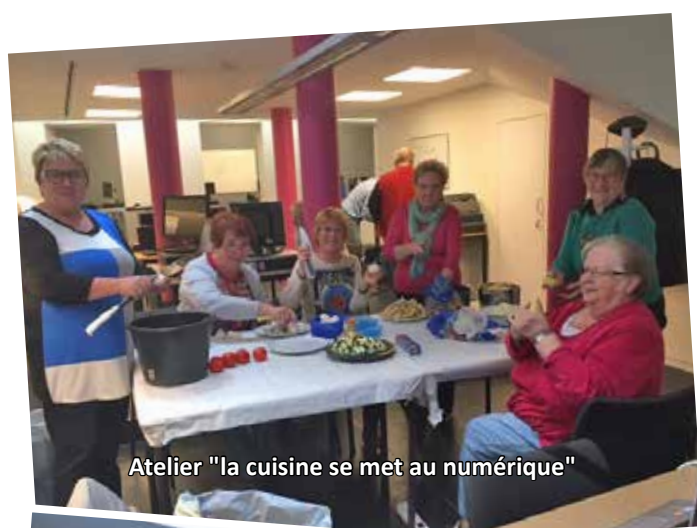
Atelier "la cuisine se met au numérique"