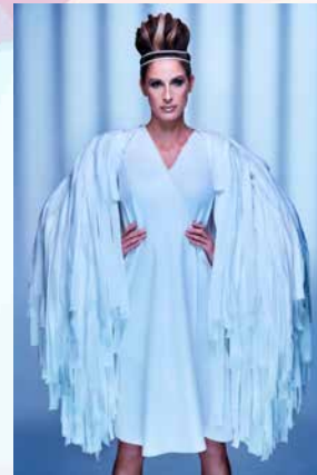
© Création Giovanni Biasolo hair S.Tieleman - mua C

C'est un professionnel de la mode et de la création qui a accepté d'accompagner la 4 e édition de la Lux Fashion Week. Giovanni Biasolo, installé à Liège, développe des concepts innovants tels que des créations uniques pour particuliers, conception de costumes de spectacles, films, ou événements.