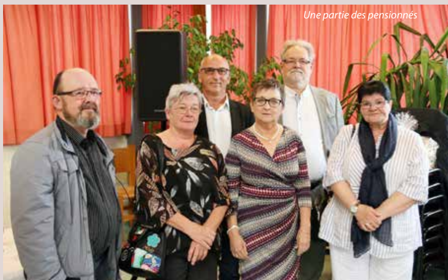
Une partie des pensionnés