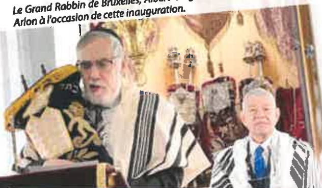
Le Grand Rabbin de Bruxelles, Albert Guigui était présent à Arlon à l'occasion de cette inauguration.

Un beau témoignage de la fraternité qui règne dans notre commune.