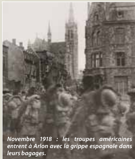
Novembre 1918 : les troupes américaines entrent à Arlon avec la grippe espagnole dans leurs bagages.

C'est en mars 1920, il y a tout juste un siècle, que fut signalé le dernier cas de grippe espagnole. L'épidémie devenue pandémie avait débuté deux ans auparavant.