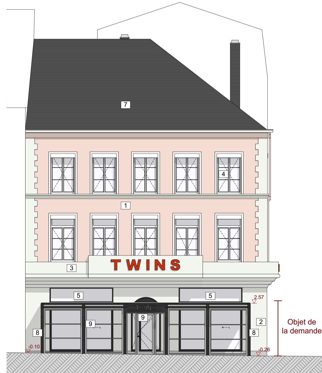
Façade Place léopold - projetée 1:100