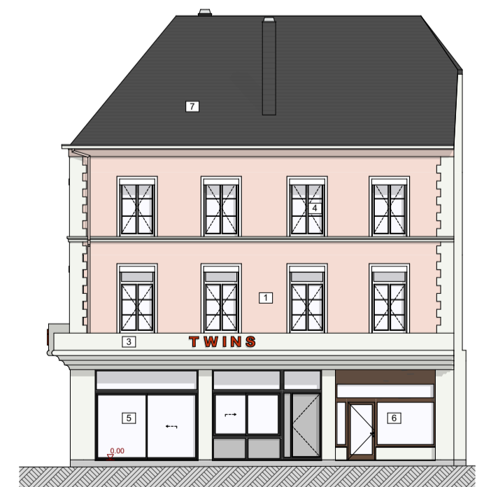
Façade Rue Léopold - Existante 1:200