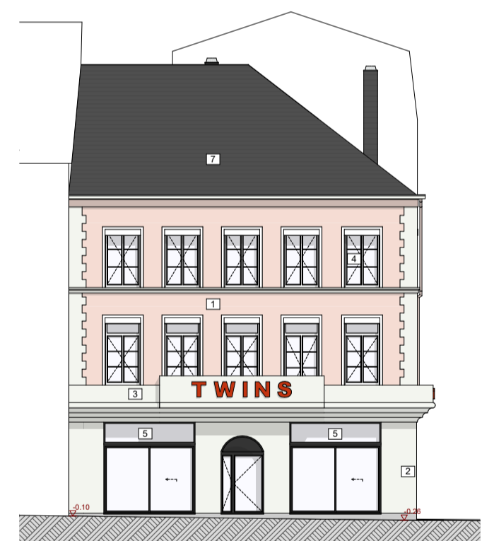
Façade Place Léopold - Existante 1:200