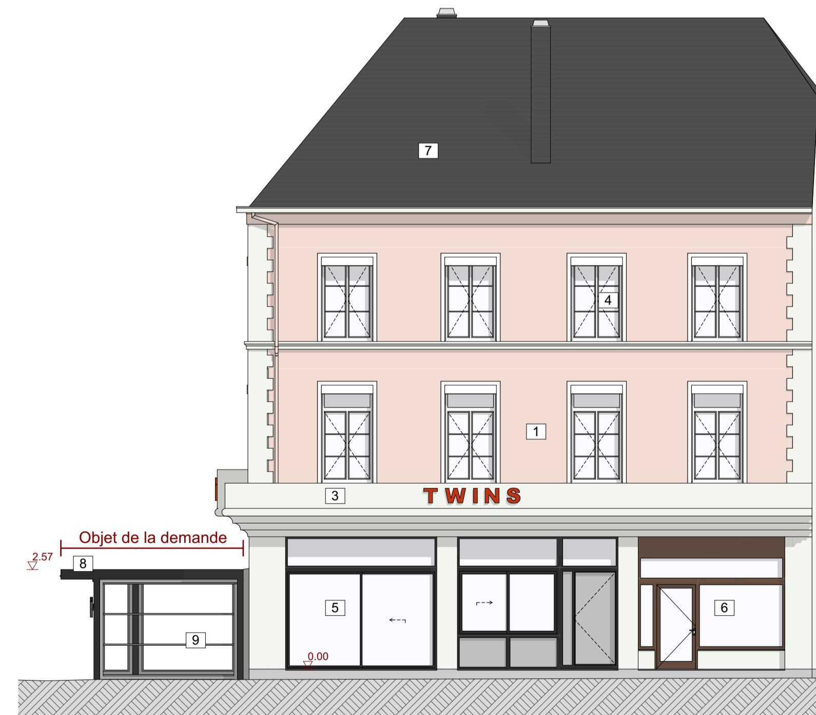
Façade Rue Léopold - projetée 1:100