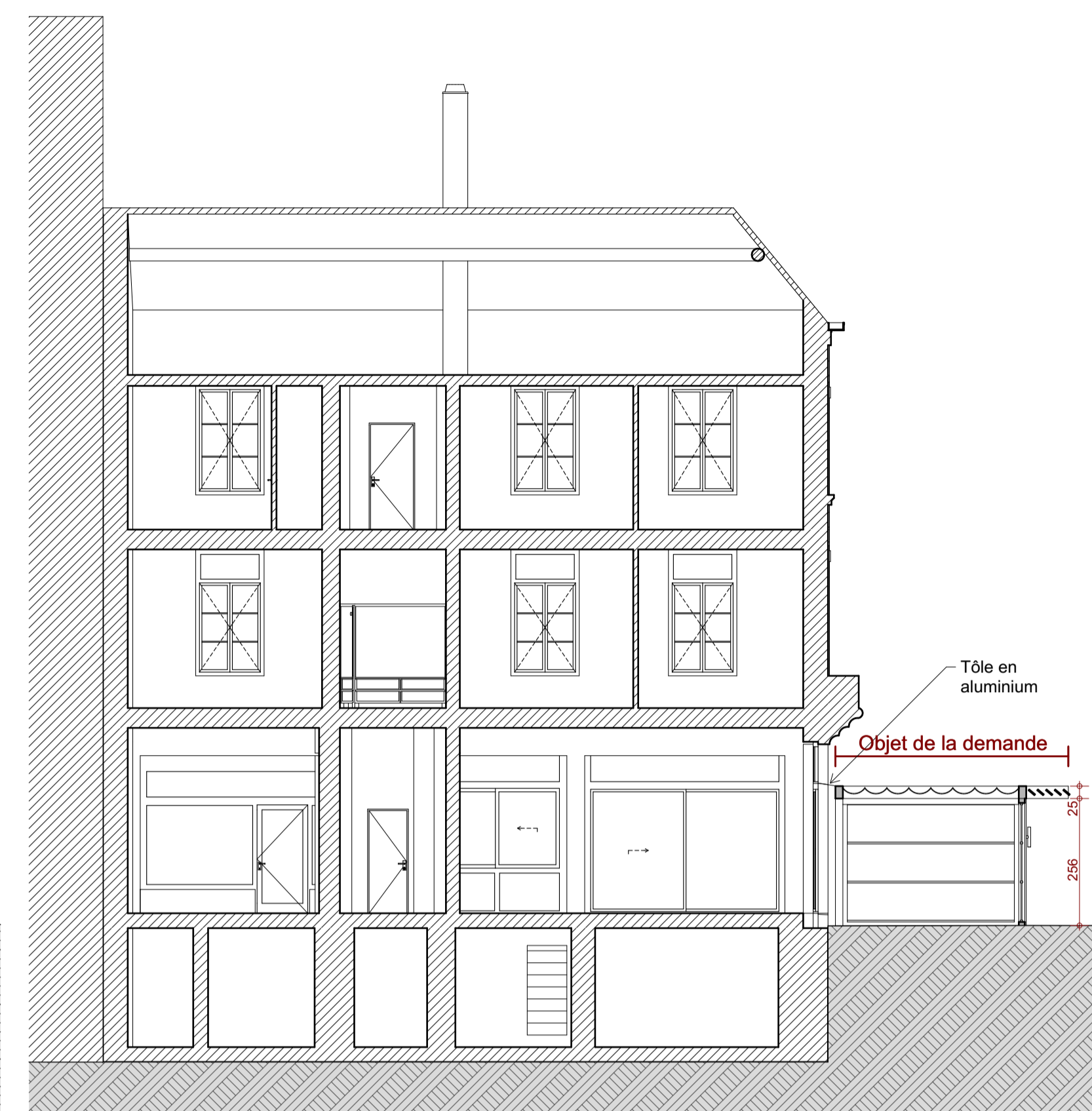
Coupe C 1:100