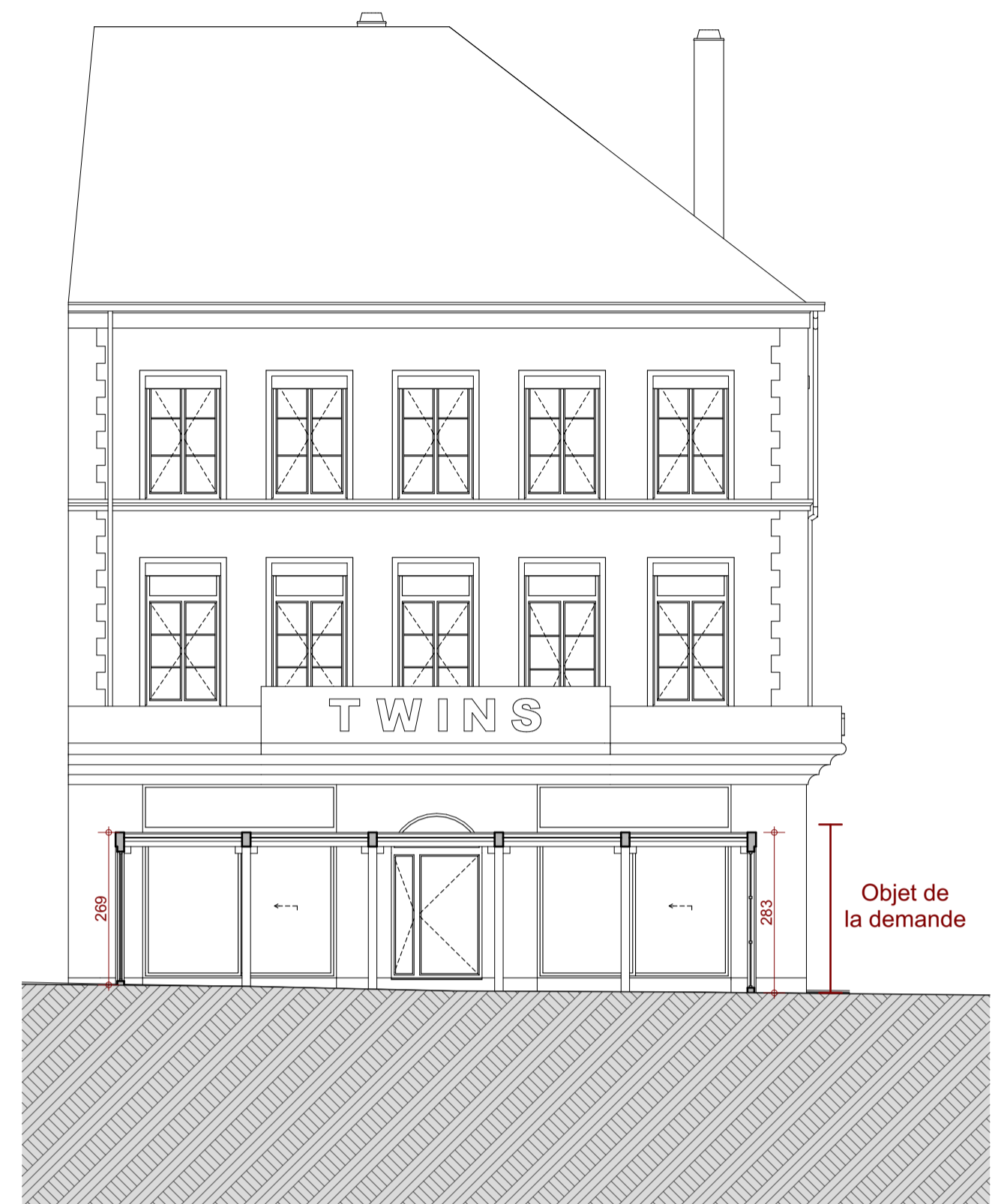
Coupe A 1:100